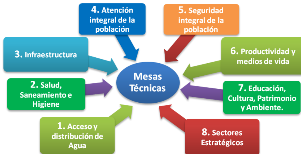
Gráfico No. 2 Mesas Técnicas de Trabajo del CGR/COE

El plenario de cada CGR/COE podrá invitar a sus reuniones a personas de entidades del país o internacionales y además conformar mecanismos adicionales a las MTT si encuentra mérito y condiciones para ello. Las mesas de trabajo en los diferentes niveles territoriales se reunirán por convocatoria del presidente del CGR/COE, de su coordinador o de la SGR.